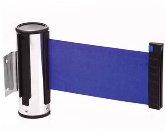
Cinta de 10 cms.

El Tensor de Cinta puede utilizarse en configuraciones de poste a superficies fijas tales como escaleras, puertas, paredes etc, permitiendole cerrar dichos accesos al publico.