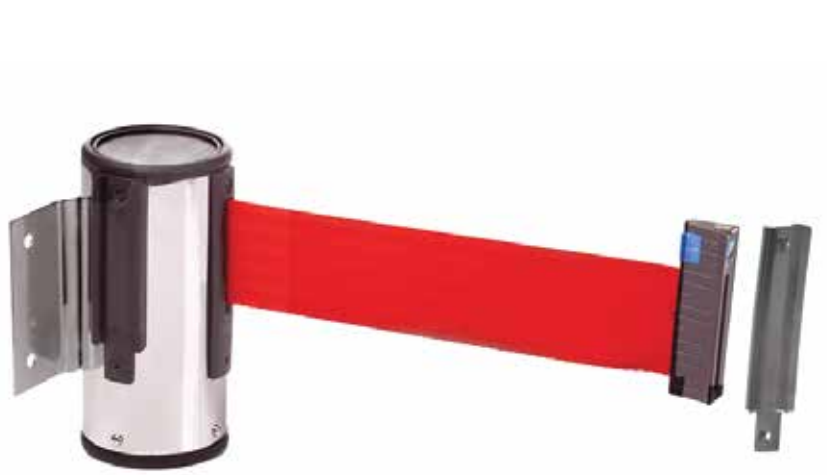
Cinta de 5 cms.